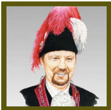
illustration Bernard Melon

Pascal Yerly wurde vor sechs Jahren inthronisiert und ein Jahr darauf während