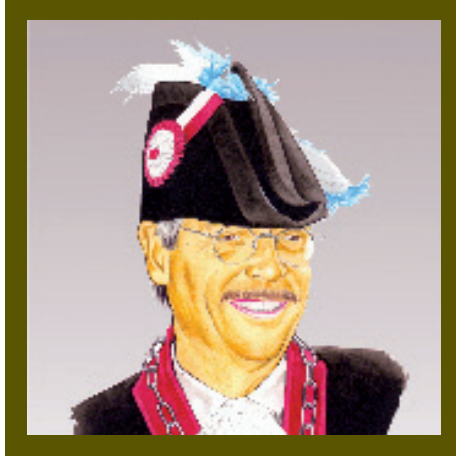
Illustration Bernard Melon

Als Vizepräsident seiner Gemeinde und Verantwortlicher für die Finanzen war er