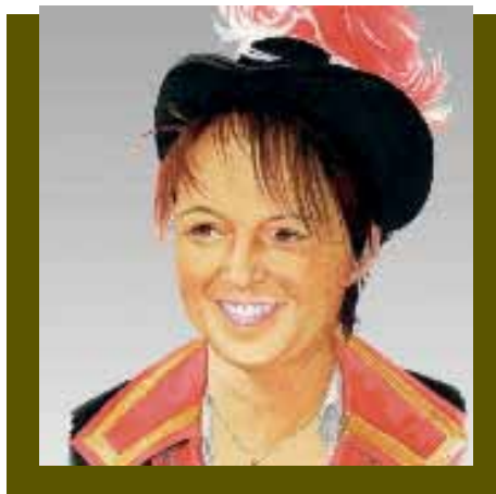
illustration: Bernard Melon

Le Sénéchal Fabienne Bruttin n'est pas une eau dormante mais au contraire elle avoue avoir besoin de stress, de défis pour